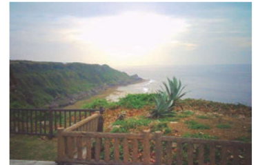
平和祈念公園からみた摩文仁の丘

沖縄の地上戦の体験を聞かせてもらいました。その様な体験や専門家から沖縄の現状を聞いた翌日から、ガイドの方の説明と共に巡る風景は、空港に到着した時とは随分違うものになっていました。知らなければ考える事も議論することもできません。戦後80年以上たち、戦争の体験について語れる方も減ってきています。機会があれば、みんなにも参加する事を勧めたいと思います。