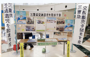
三重県交通遺児を励ます会