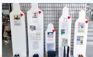
生命のメッセージ展in三重