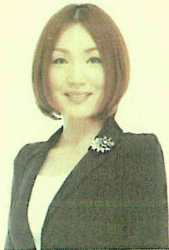
武田 美保 名誉会長

京都府生まれ。アトランタ・シドニー・アテネの3つのオリンピックで、銀・銅合わせて5つのメダルを獲得。（日本人女子選手個人が持つメダル数ではデュエットパートナー・立花美哉とならび、歴代1位）2011年 三重大学特任教授就任。 2012年 三重県ユニセフ協会 名誉会長就任。2013年 文部科学省「教育再生実行会議」の有識者メンバーに選出。